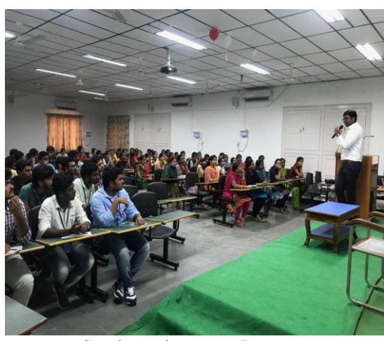
Students in guest Lecture